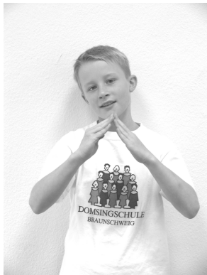
Ich hab ein Haus,