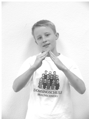
Ich hab ein Haus, ein kunterbuntes Haus,