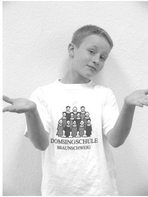
Wide, wide, wer will's von mir lernen?