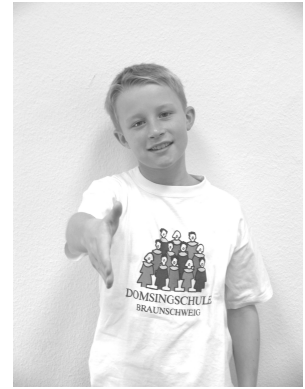
tralalala lad' ich zu mir ein.