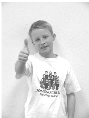
kriegt unser 1x1 gelehrt.