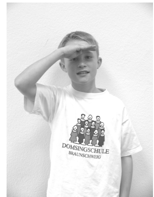
die schauen dort zum Fenster raus.