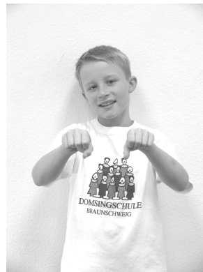
und ein Pferd,