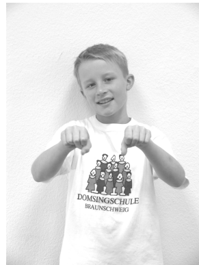
und ein Pferd,