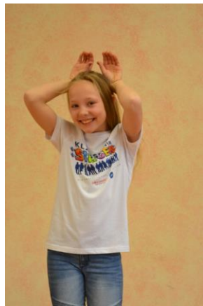
2. Wir werden immer größer, Wie in der 1. Strophe