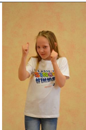
donnert oder schneit: