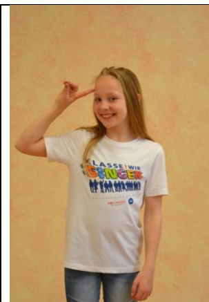
und auch geseh.