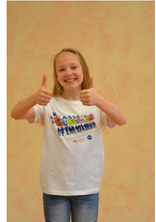
ganz von allein!